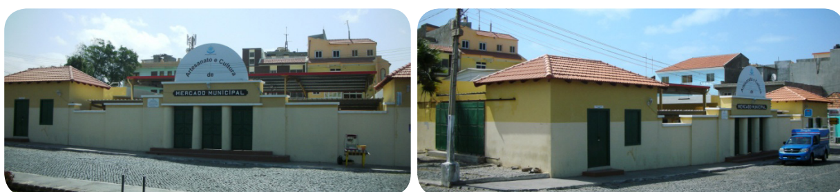
Ilustração 64: Mercado da Cultura (Ex Mercado Municipal).

Circunvizinho à praça municipal, foi construído em 1935 e recentemente remodelado mas manteve-se a traça original da sua fachada principal. O antigo mercado municipal é atualmente palco de várias atividades culturais e recreativas, tomando a designação de Mercado Municipal da Cultura e transferindo as atividades do primeiro mercado para o novo edifício construído na entrada da cidade do Tarrafal. O imóvel em questão tem um profundo valor histórico-patrimonial para a população do concelho e encontra-se em bom estado de conservação.