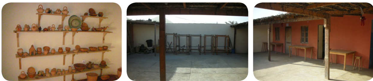
Ilustração 73: Sala de exposição (à esquerda), pátio de produção (no meio) e salas de formações (à direita).

O Centro apresenta exposições baseadas na cultura material do concelho, numa vertente etnográfica, podendo apreciar-se algumas peças antigas como, olaria, panaria e cestaria, assim como os instrumentos utilizados na sua execução. O conteúdo deste espaço pretende constituir uma fonte de conhecimento directo para quem o visita, através de painéis informativos e audiovisual.