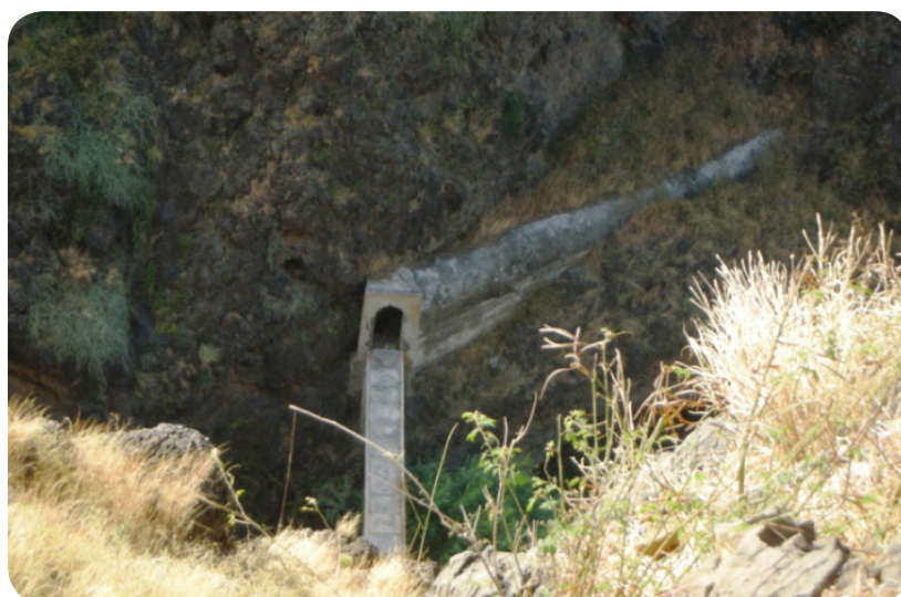
Ilustração 52: Ruínas do aqueduto localizado entre Chão Bom e Ribeira das Pratas.

Este é um dos vales mais verdejantes do concelho, onde se pode encontrar coqueiros, mangueiras e muitas outras árvores de frutas, para além de diversos tipos de hortaliças e legumes. A localidade já foi a maior abastecedora de água das localidades de Colonato (zona agrícola), Chão Bom e cidade do Tarrafal, pelo que ainda hoje pode-se contemplar o sistema de aquedutos construídos na época colonial para o transporte de água até às referidas zonas.