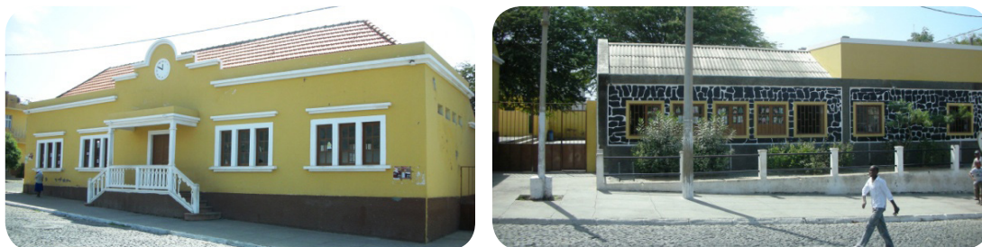
Ilustração 63: Escola Central.

Localizado na praça municipal, foi erigido em 1935. Destaca-se pela sua traça colonial e por ter sido a primeira escola do concelho. Arquitetura de estilo colonial, encontra-se em mau estado de conservação, necessitando de algumas intervenções.