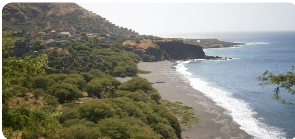
Ilustração 54: Praia de Ribeira das Pratas.