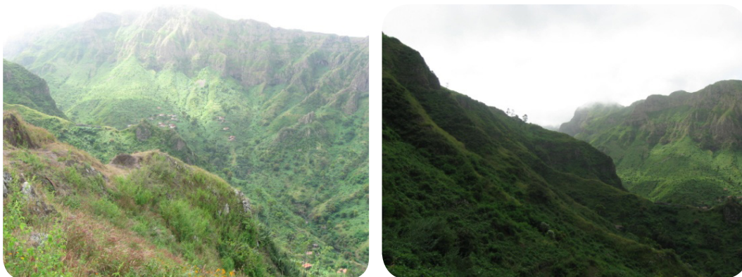
Ilustração 39: Serra da Malagueta.