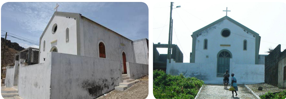
Ilustração 71: Capela de Ribeira das Pratas.