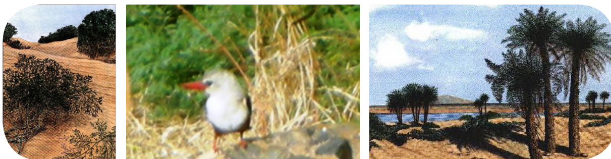
Ilustração 38: espécies da flora e fauna.

O concelho do Tarrafal no que tange aos recursos naturais apresenta uma grande diversidade de paisagens, da flora e da fauna da ilha de Santiago, destacando o Tarrafe ( Tamarix senegalensis ) da qual originou o nome da localidade pela abundância em tempos deste arbusto e algumas palmeiras, a passarinha ( Halcyon leucocephala ), a Tchota-de-Cana ( Acrocephalus brevipennis ) a Tcota-de-Coco ( Passer hispaniolensis ).