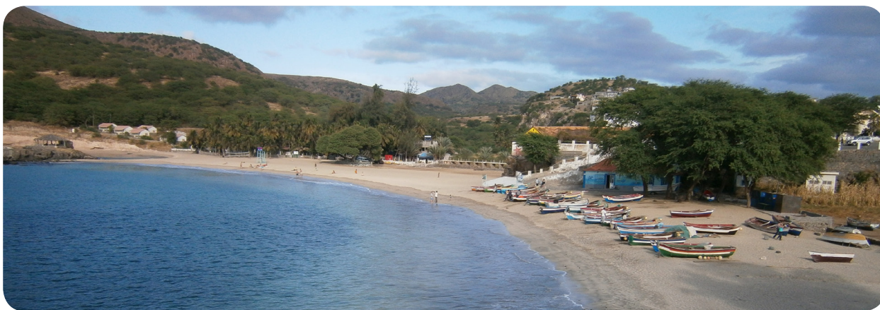
Ilustração 51: Ribeira de Fontão e Baía do Tarrafal (Praia de Mangue).