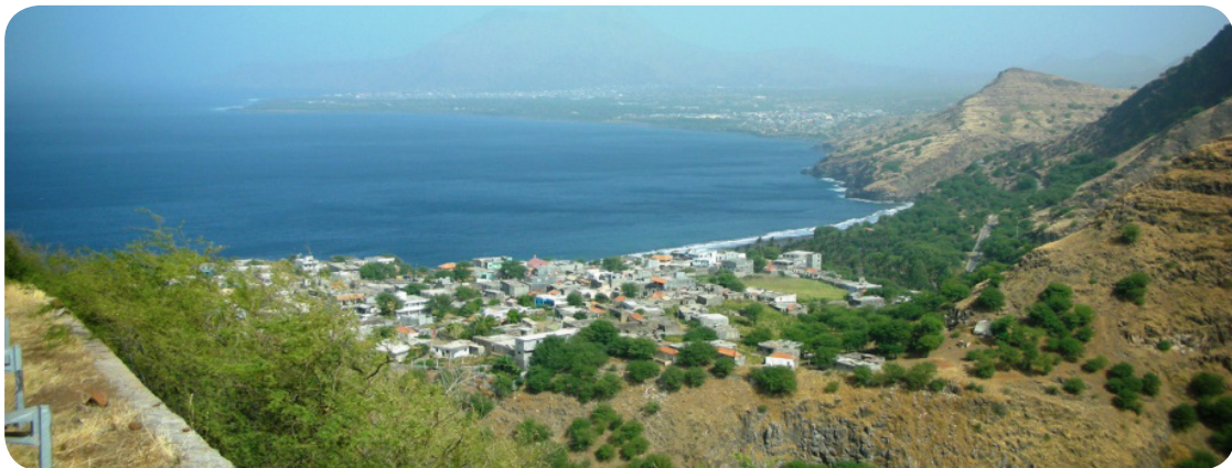
Ilustração 46: Vista sobre o litoral Oeste de Tarrafal da estrada para Figueira Muita.

De Ribeira das Pratas sobe-se para a localidade de Figueira Muita em estrada asfaltada, proporcionando excelentes panoramas sobre as três principais comunidades do concelho de Tarrafal - Ribeira das Pratas, Chão Bom e cidade do Tarrafal - bem como pelos seus vales majestosos, principalmente o que a separa de Achada Meio.