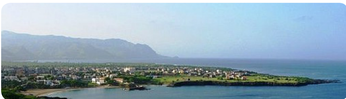
Ilustração 43: Cidade do Tarrafal.

Principal polo administrativo do concelho, apresenta diversas singularidades potenciais para o desenvolvimento do turismo local, quer nos aspetos culturais, todo centro histórico como outros edifícios espalhados na cidade com valor histórico-cultural, como na vertente ambiental e paisagística, o monte Graciosa, as praias com coqueiros e diferentes endemismos da flora e fauna do país, e ainda ao nível das atividades de animação turística, como as discotecas, o cineteatro, bons restaurantes típicos, pequenos botequins animados com música local, o parque de manutenção física, entre outras.