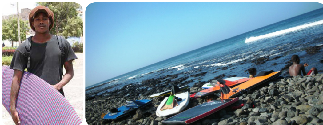
Ilustração 53: Surfista Kabongo e jovens surfistas, na Praia de Ponta D'Atum.

Do lado oeste da baía do Tarrafal fica a praia de Ponta de Atum, famosa pelas magníficas ondas para a prática do Surf e Body Board e onde tem lugar uma etapa do campeonato nacional destas duas modalidades de desportos náuticos.