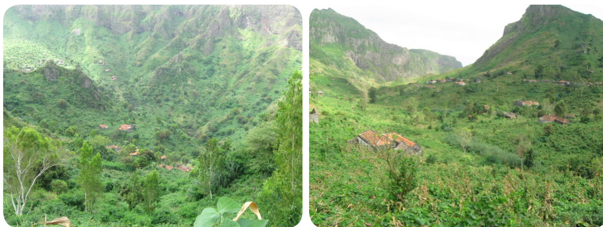
Ilustração 49: Lagoa e Achada Lagoa.

Por um caminho suave e seguro chega-se a Lagoa, à medida que se aproxima das primeiras casas a ribeira parece engolir os seus vistantes dentro das suas altas e majestosas encostas basálticas. Daqui existe um outro caminho que segue até a comunidade de Achada Lagoa, constituída por algumas casas tradicionais dispersas e pode-se observar cenários interessantes sobre a ribeira de Lagoa e o monte Quintolanço que é sem dúvida uma experiência inesquecível de passagem.