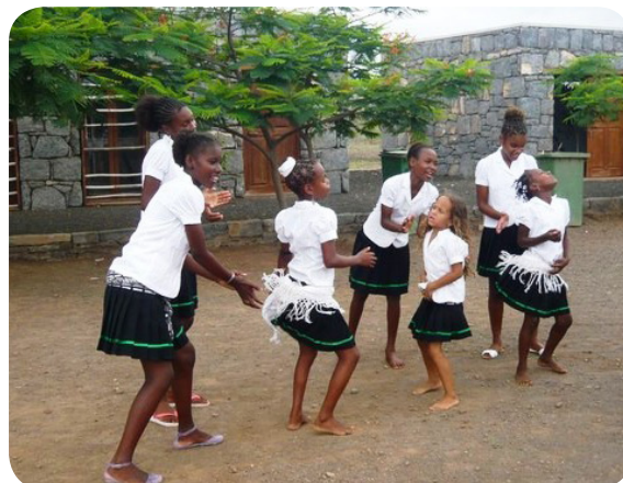
Ilustração 77: Batucadeiras.