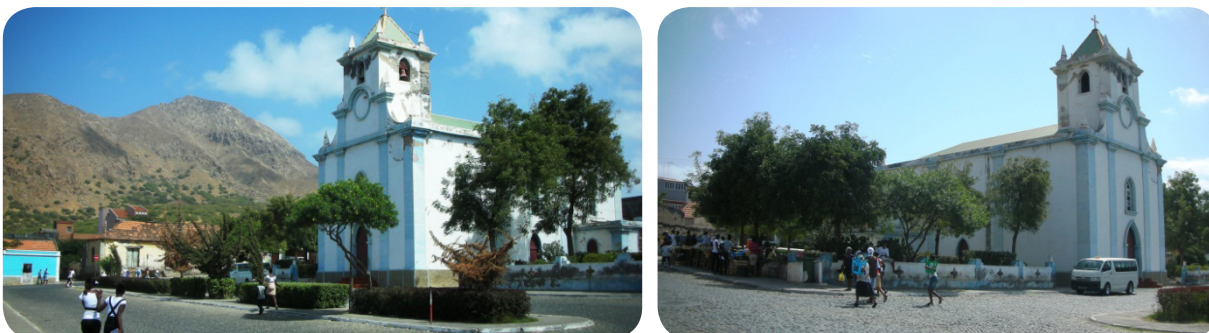
Ilustração 62: Igreja Matriz Santo Amaro Abade.

Tem como patrono Santo Amaro Abade, cuja festa é realizada no dia 15 de Janeiro e pelo seu valor sacro, em concertação com a entidade responsável, pode ser uma parte importante de visita no concelho.