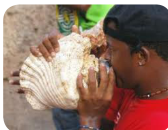
Ilustração 78: Tabanka.