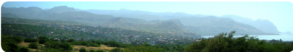
Ilustração 44: Chão Bom.