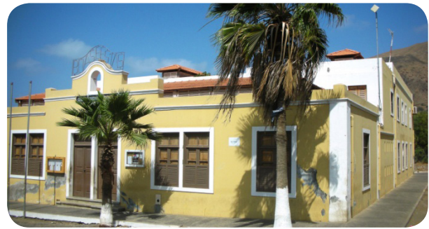
Ilustração 60: Praça Municipal.

Por esses motivos pode ser transformado num ponto de encontro agradável entre visitantes e população local agrupado a outras como a Praça México e Praça Custódio.