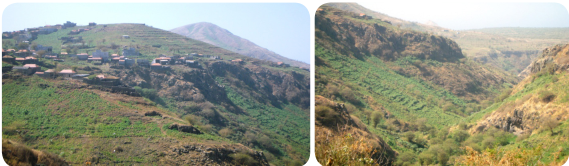
Ilustração 48: Achada Moirão.

É uma localidade que tem nas suas gentes, nas maravilhosas vistas panorâmicas que se desfruta até ao fundo dos vales e nalgumas aldeias desabitadas como Belém, Chão de Capela, Ribeirão Carrasco, Tamareira e Água de Garça, sem dúvida, o maior atrativo local.