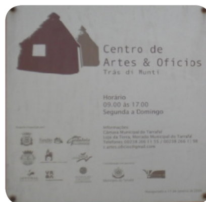
Ilustração 72: Centro de Artes e Ofícios de Trás-os-Montes (à esquerda) e placa informativa.

É constituído por uma recepção, uma sala de exposição, um pátio de produção de peças de panaria e tecelagem e pequenas salas de formações onde os artesão aprendem a arte de moldar o barro, da fabricação dos panos de terra e dos chapéus de palha, a cestaria e a manufatura de jóias tradicionais.