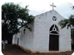
Ilustração 47: Capela de Trás-os-Montes.

A atual capela de S. José, que em 1909 funcionou como sede do Instituto de Formação das Alunas Internas e Externas, orientado pela congregação Irmãs dos Pobres, foi ainda a primeira Igreja Matriz de Santo Amaro Abade, padroeiro da freguesia.