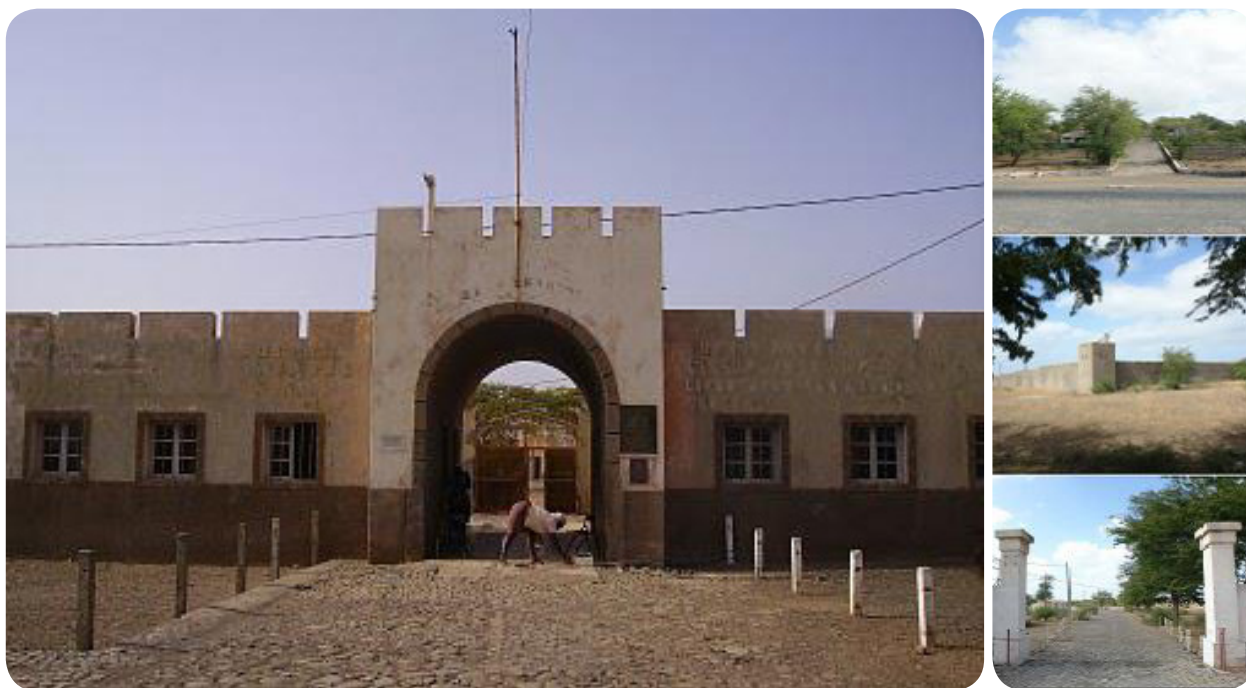
Ilustração 58: Campo de Concentração do Tarrafal.

Edificado na zona de Chão Bom, ao fim de uma primeira fase, 1936 a 1954 – onde recebeu somente presos portugueses, que ultrapassaram uma centena – passou a receber nacionalistas das colónias portuguesas. Nos seus 38 anos de funcionamento, em que serviu igualmente como prisão para presos de delito comum, além de indivíduos de outras nacionalidades europeias passaram pelo “campo da morte lenta”, como também ficou conhecido devido às condições precárias de enclausuramento e o aumento de penas, 340 portugueses e 230 africanos, entre os quais 20 cabo-verdianos.