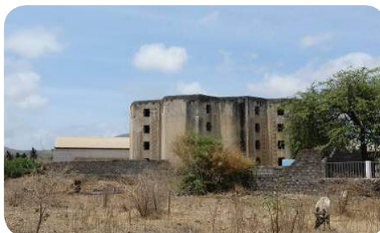
Ilustração 69: Silo do Colonato.