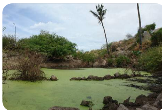
Ilustração 57: Pedra Empena.