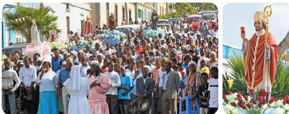
Ilustração 75: Festa e imagem “Nhu” Santo Amaro Abade.

Celebrada a 15 de janeiro na Igreja Matriz do concelho, a festa de “ Nhu Santo Amaro ” atrai muitas pessoas oriundas de outras paragens do país bem como do mundo fora. Sendo a festa de maior destaque, coincide com as celebrações do dia do município onde acontece o Festival de Santo Amaro, que é um espaço de promoção da cultura e dos grupos e artistas locais, preferencialmente.