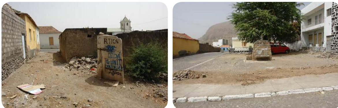
Ilustração 67: Fontenários para o espaço verde (á esquerda) e ao lado da casa Narina.

Localizados no centro da cidade, foram dos primeiros fontanários do concelho, construídos em 1961. Encontram-se degradados e podem ser dos principais motivos para a reabilitação dos largos onde se situam.