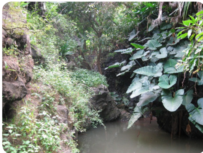
Ilustração 50: Uma lagoa na localidade de Lagoa.

No concelho existem algumas pequenas lagoas e nascentes, destacando-se as nascentes de Achada Lagoa, Lagoa, Mato Brasil e Pedra Impena que constituem uma verdadeira benção para as suas gentes, bem como para o desenvolvimento da agricultura local e do turismo rural nas suas diferentes vertentes.