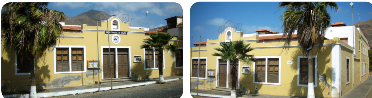
Ilustração 61: Paços do Concelho.

Também erigido em 1935, foi alvo de intervenção com obras de remodelação em 2004 preservando-se em parte a sua arquitetura original. É o edifício que alberga o poder administrativo a nível local e se encontra em bom estado de conservação.