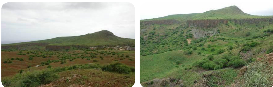
Ilustração 42: Monte Costa.

Em forma de uma rampa eleva-se sobre a achada Costa, atingindo uma altitude de cerca de 300 metros e uma superfície de 153,4ha. Este cone piroclástico destaca-se na paisagem de forma notória pela sua beleza.