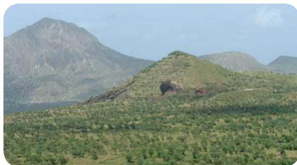
Ilustração 41: Monte Achada Grande.

Este cone vulcânico de cor avermelhado, com uma superfície de 66,5 ha, localiza-se na Achada Grande e é uma referência paisagística municipal. Em termos geológicos é constituído por piroclásticos (jorra) e escórias da formação do Monte das Vacas, que lhe confere grande infiltração, fundamental para a alimentação dos aquíferos, representando uma das principais zonas de alta infiltração no município.