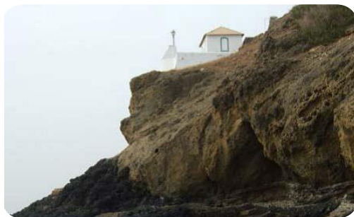
Ilustração 68: Farol de Ponta Moreira (á esquerda) e Ponta Preta .