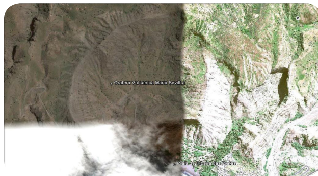
Ilustração 56: Cratera Maria Sevilha.