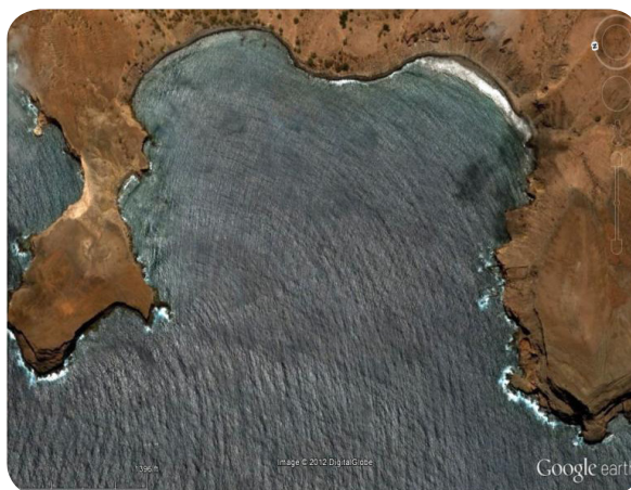
Ilustração 55: Praia da Fazenda.

Praia de difícil acesso, mas vista pelos decisores locais como um dos atrativos turísticos com fortes potencialidades no concelho e por isso, está-se a traçar medidas necessárias para a sua inclusão no roteiro turístico do destino Tarrafal.