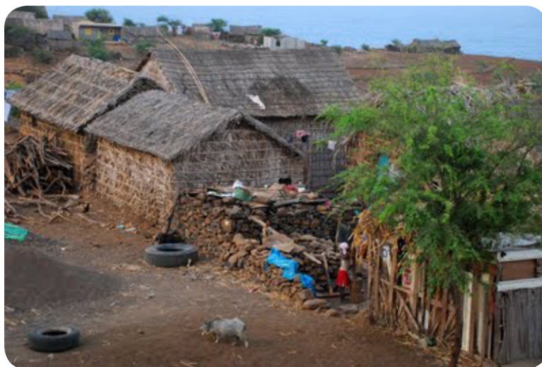
Ilustração 76: Aldeia de Rabelados.

No concelho existe várias comunidades de Rabelados nas localidades de Lagoa-Gémea, Lapa Catchor (Cachorro), Bimbirim em Achada Biscainhos e Bicuda.