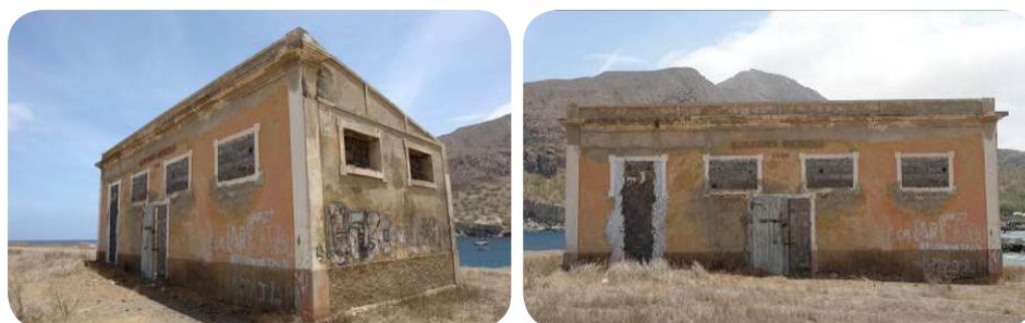
Ilustração 66: Ex. Matadouro.

Construído em 1940, fica a escassos metros da “Praia do Presidente”. Nunca funcionou e encontra-se em estado de degradação. Segundo o PDM local, a sua requalificação, mantendo a traça original passará pela mudança de uso, ligado a recreio e lazer junto a faixa litoral.