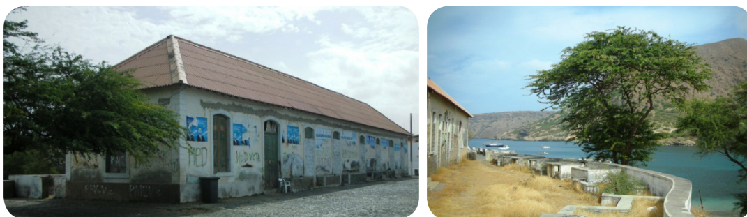
Ilustração 65: Alfandega Velha.

Encontra-se em mau estado de conservação, mas pode e deve ser-lhe atribuído algum uso, pois encontra-se num ponto estratégico da cidade e possui uma grandiosa estrutura.