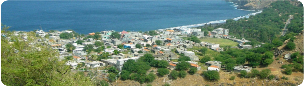
Ilustração 45: Ribeira das Pratas.

As principais atividades económicas são a pesca, a agricultura e a criação do gado o que confere ao lugar potencialidades para o desenvolvimento do turismo em espaço rural, aproveitando as casas dos locais para alojar os visitantes, contribuindo especialmente para o aumento da renda das famílias residentes.