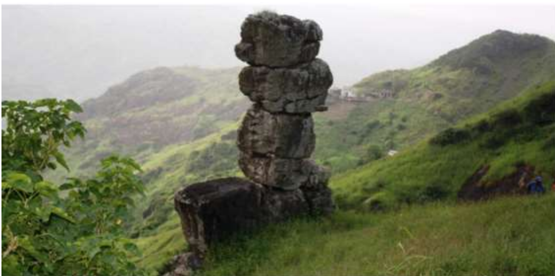
Figura 12: Parede (DE DEUS) Nhordés

Situado na encosta do Monte Bidela e constituída por rochas basálticas, sobrepostas umas em cima da outra e alinhadas dando a impressão de uma parede. É um conjunto de pedras enormes sobrepostas que parecem terem sido colocadas de propósito. Singulariza-se pela sua imponência na paisagem e beleza cénica que desperta curiosidade dos visitantes.