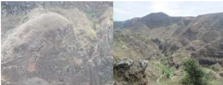
Figura 3: Miradouro de Portal e vista panorâmica captada no local.