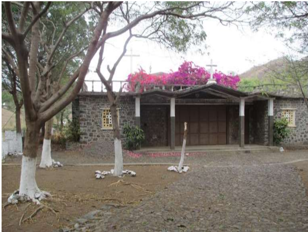
Figura 24: Capela de Nossa Senhora de Conceição Fonte: Equipa Técnica

Situa-se na localidade de Banana, no Município de São Domingos. As festas de Nossa Senhora de Conceição é comemorada a 8 de Dezembro. A igreja encontra em estado de conservação degradada. Trata-se de uma igreja cujo estilo arquitetónico é moderno e não dispõe de cobertura. Dispõe de um pátio e árvores de sombra. A igreja é de fácil de acesso. Carece de algum cuidado devido ao seu estado de conservação relativamente degradado. É de fácil acesso.