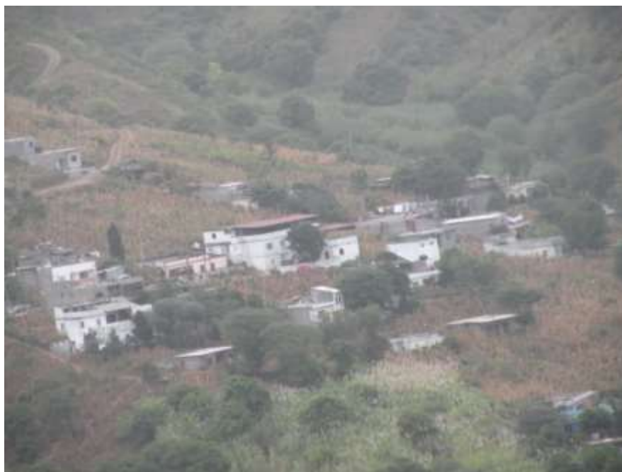
Figura 2: Localidade de Água de Gato

Apresenta um relevo acidentado coberto de vários tipos de vegetação, considerada o “pulmão de S. Domingos”. Uma das espécies arbóreas que se destaca na paisagem é Calabaceira. Nesta localidade existem nascentes com cursos de água permanente, como é o caso da Laranjeira, Ribeira Grande e Galeria de Ribeira Baixo. Água de Gato foi o local onde nasceu e viveu o famoso poeta, dramaturgo, músico e compositor Fulgêncio Tavares, mais conhecido por “Ano Nobu”, de Lém Pereira.