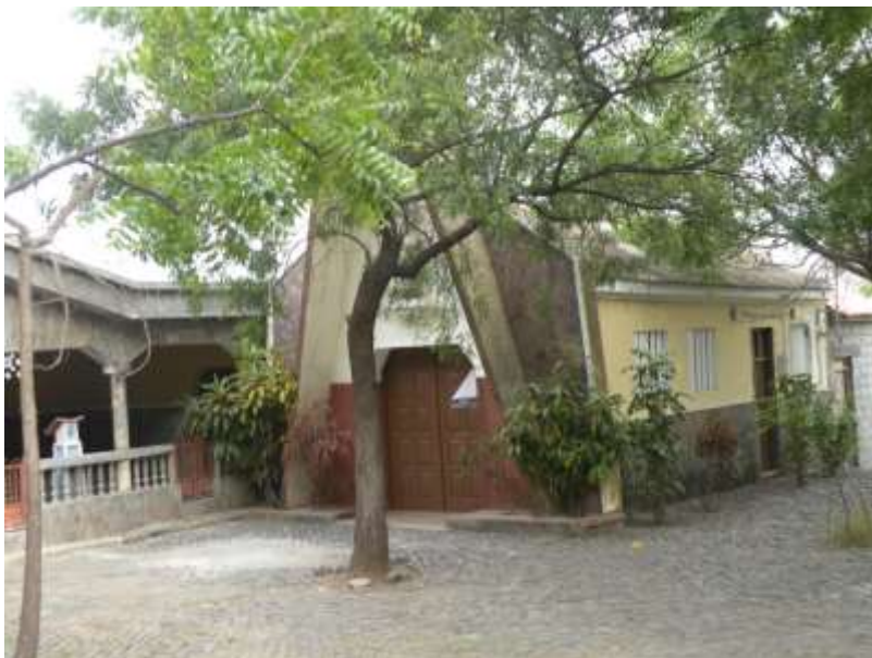
Figura 20: Capela de Sagrada Coração de Jesus

É um património religioso situado na zona de Godim, construída recentemente que apresenta um estado de conservação regular. É de fácil acesso devido a sua localização, ou seja, fica situada ao lado da estrada principal. Este património pode integrar o roteiro turístico religioso e cultural.