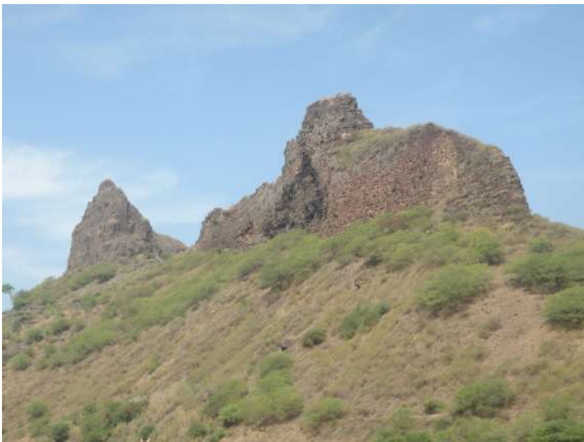
Figura 7: Monte Nora

ou contemplado a qualquer época do ano mas, é mais convidativa na época das chuvas que cobre de verde.