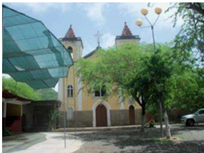
Figura 16 Igreja de S. Domingos

Nesta Igreja reza-se a missa em homenagem a vários Santos entre os quais, se destacam São Nicolau Tolentino no dia 10 de Setembro e São Domingos (Nhu Febreru) no dia 2 de Fevereiro. As festas religiosas nesta cidade atrai normalmente fiéis oriundos de vários pontos de Santiago. É uma festa alegre e muito rija celebrada com muita vivacidade.