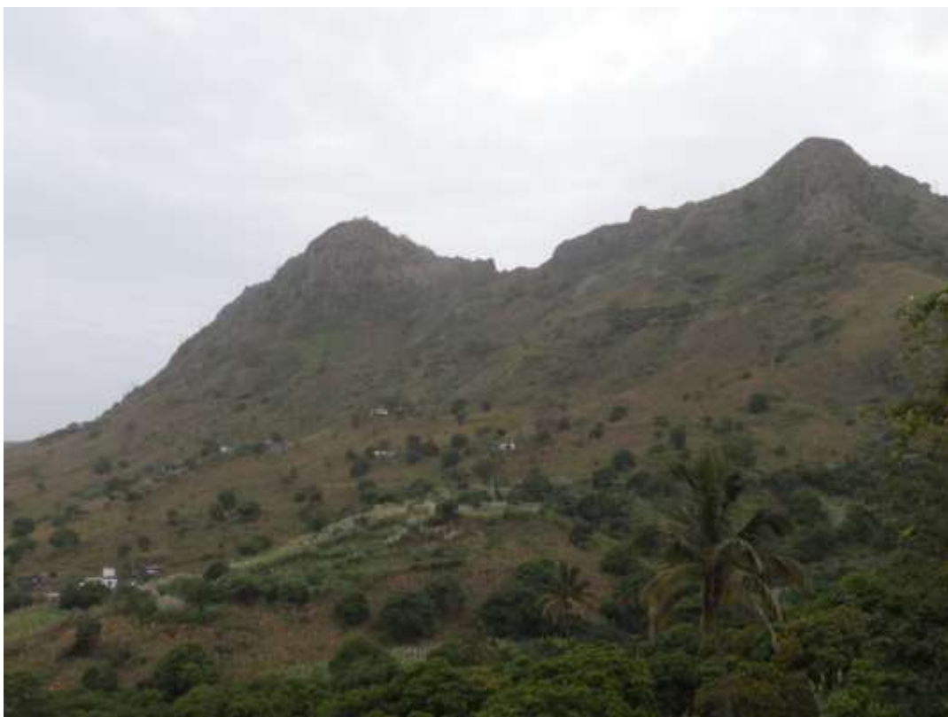
Figura 10: Monte Gémeos de Caiada

É um património natural situado no alto da localidade de Caiada e a caminho de Rui Vaz. A sua configuração aparenta a imagem de duas irmãs gémeas. A partir deste monte pode-se ter uma ampla vista panorâmica de todo o vale de São Domingos.