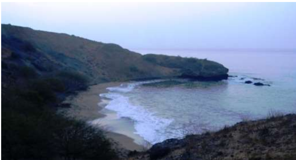
Figura 15: Praia de Praia Baixo Fonte: Sete Mravilhas