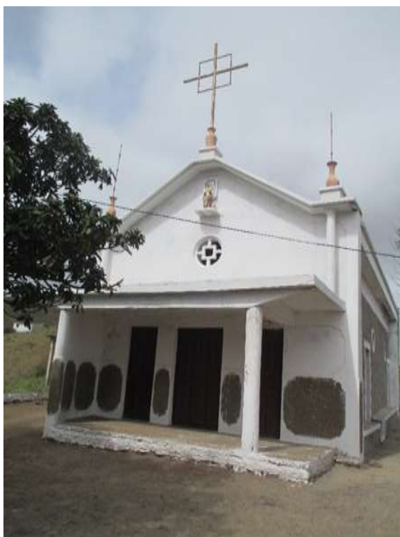
Figura 25: Igreja de Ponta Baixo

Situada na Zona de Rui Vaz, mais concretamente na Zona de Ponta baixo. Trata se de uma igreja que foi construída na década de 90. Nessa igreja comemora-se a Sagrada Família, no primeiro Domingo depois do Natal. No pátio tem uma espécie arbórea com formato de Dragoeiro, cujo nome comum na zona é “borracha” O sítio onde a igreja esta localizada constitui um autêntico miradouro natural que proporciona uma vista panorâmica da Cidade da Praia, Vale de São Domingos, São Francisco, Monte Leão.