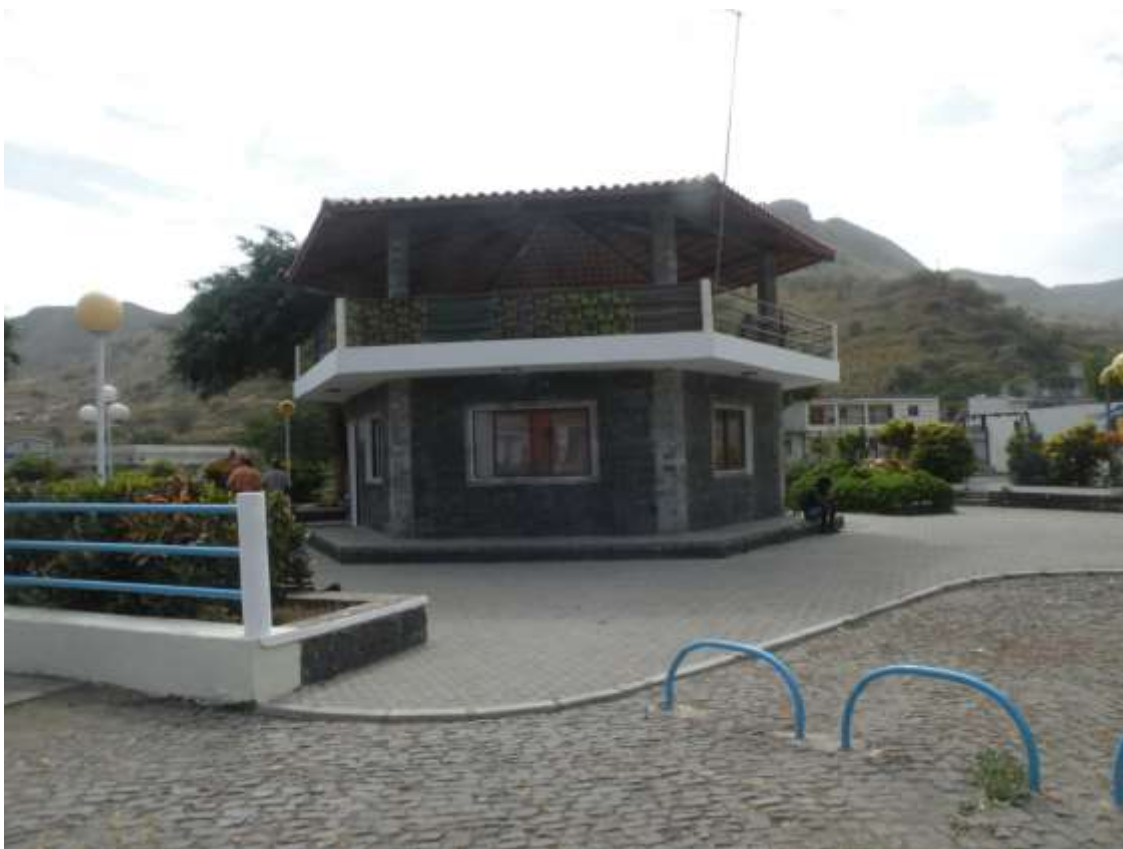
Figura 26: Praça “Pedra Pedra”