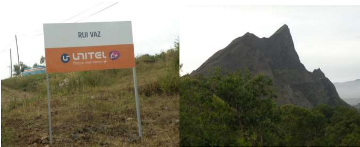
Figura 1: Rui Vaz e Monte Pico de Antónia