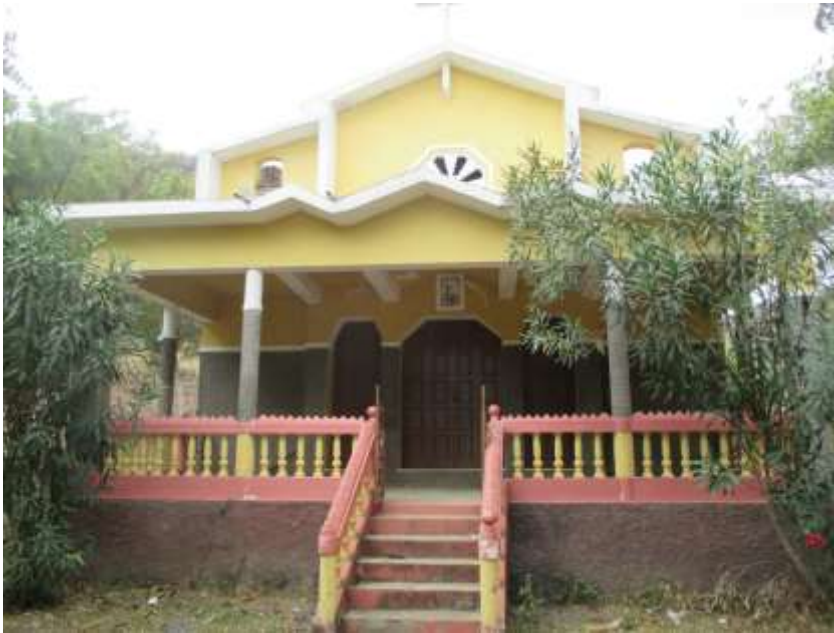
Figura 22: Capela de Imaculada Coração de Maria