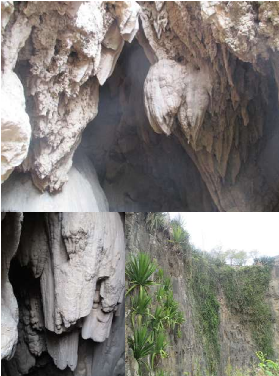
Figura 11: Gruta de Ribeirão de Cal

O acesso é difícil e a sinalização carece de precisão. Nas proximidades faz-se a prática de agricultura de regadio. De acordo com os moradores ultimamente tem tido alguma procura por parte dos visitantes estrangeiros o que testemunha a importância da referida gruta enquanto atrativo turístico de grande alto valor.