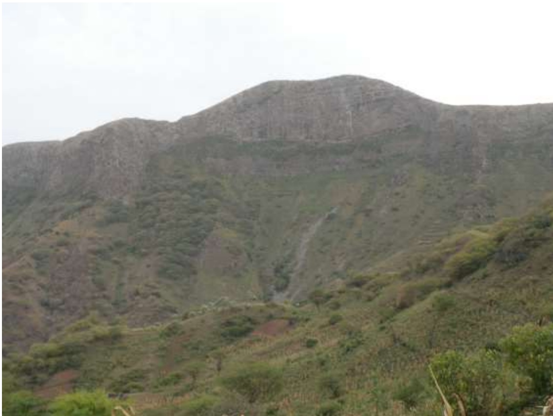
Figura 9: Vale de Ribeira Fundo

Encontra-se localizado na encosta norte do município e na parte sul de Rui Vaz. Apresenta uma morfologia caracterizada por encostas abruptas e verdejantes, vales profundos, com mantos de espécies vegetais endémicas que a torna uma paisagem relativamente exuberante, no contexto de Cabo Verde. Para quem sobe Rui Vaz, logo na entrada se depara com esta paisagem que lhe convida a contemplação e fotografias. Ali se pode desenvolver atividades tipo escaladas, rappel e caminhadas.