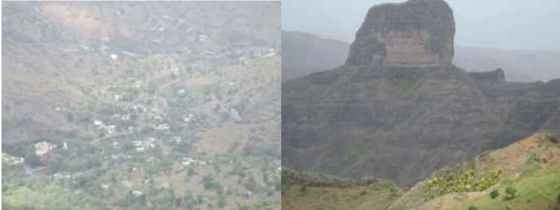
Figura 4: Vista panorâmica captada, a partir de Cabeceiras do vale de São Jorge