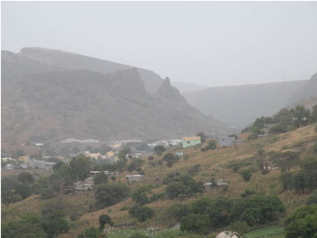
Figura 5: Vale de São Domingos