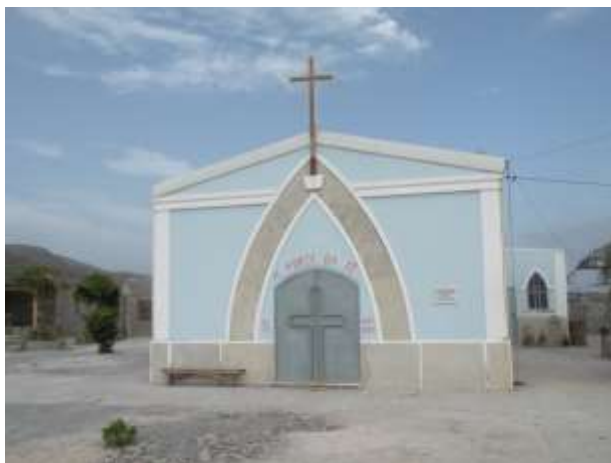
Figura 21: Capela de N.S. de Estrela do Mar