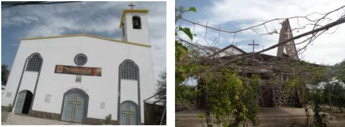
Figura 18: Igreja de N. S. de Fátima – Milho Branco

depois de 13 de Maio. Pertence à Paroquia de Nossa Senhora da Luz e, é um património religioso muito acarinhado pela comunidade cristã dessa freguesia.