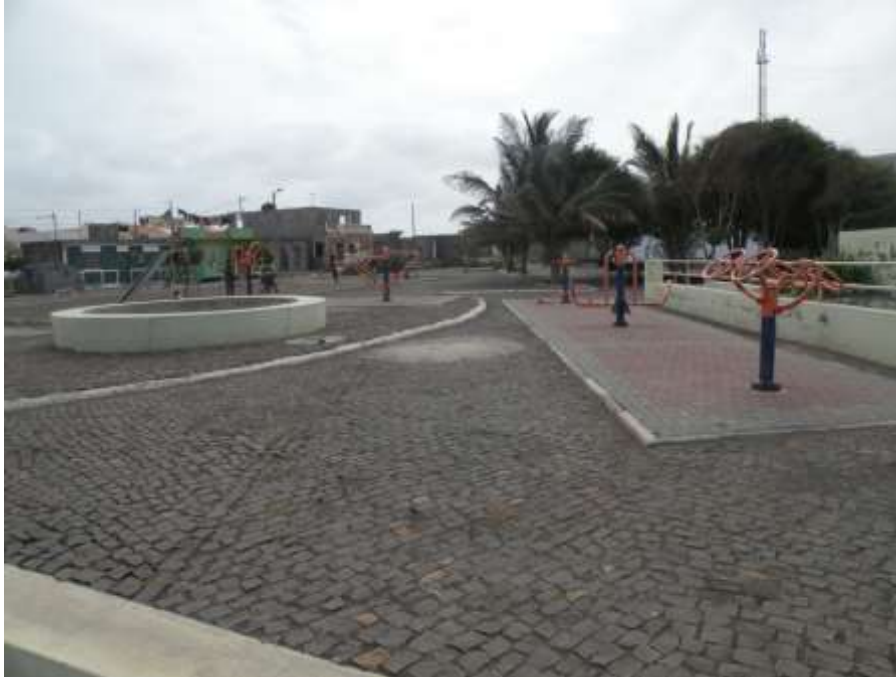
Figura 27: Praça de Praia Baixo