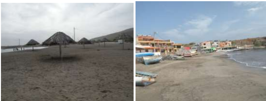
Figura 14 Praia de Praia Baixo

É uma praia de perfil longitudinal, localizado na zona sul do município de São Domingos. Uma das praias mais vastas da ilha de Santiago, com uma extensão de cerca de (...) e constituída por uma mistura de areia branca e preta, originando um tom de cinza claro, o que difere das outras praias. Dispõe de equipamentos de sol e à sua volta alguns serviços de apoio turístico.