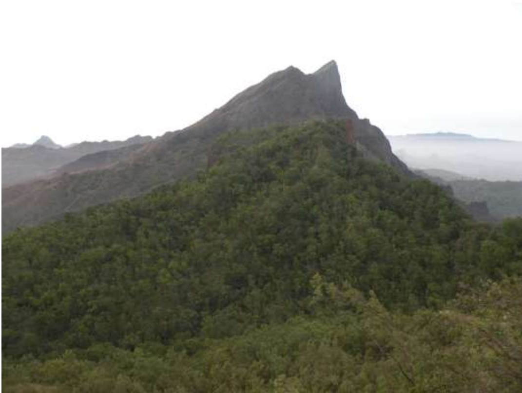
Figura 8: Parque Natural de Rui Vaz e Pico de Antónia

É uma extensa área de cobertura vegetal que estende à norte da zona de Rui Vaz e Loura até à serra de Pico de Antónia, passando por “Monte Tchota”.