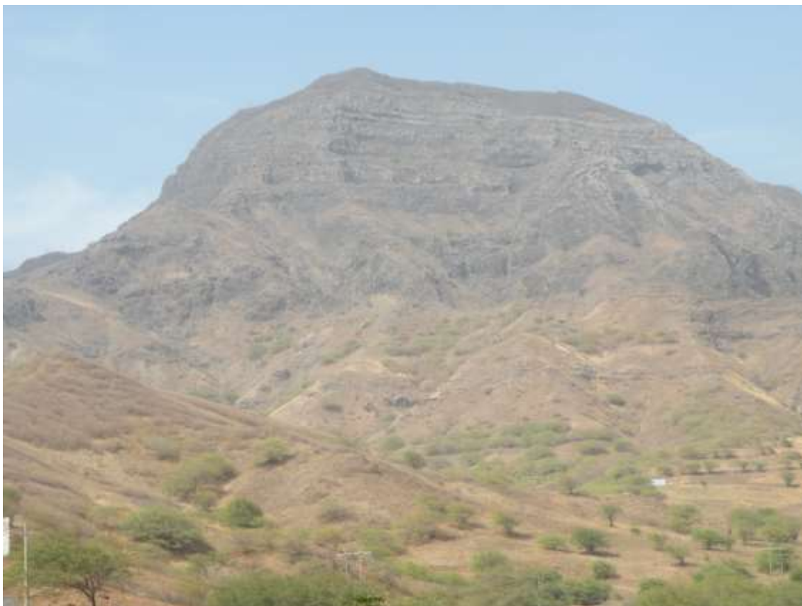
Figura 6: Monte Bidela