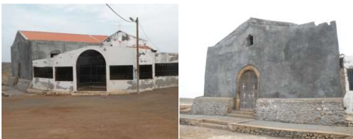
Figura 17: Igreja de N.S. da Luz

A Igreja de Nossa Senhora da Luz, situa-se na zona de Baía dos Alcatrazes. Foi uma das primeiras Igrejas construída pelos portugueses nos trópicos, além da de Nossa Senhora do Rosário, na Cidade Velha. Sofreu obras de remodelação recentemente cujas intervenções deixa entender que houve uma certa descaracterização, fugindo um pouco ao padrão inicial. Contudo, é um património histórico nacional que se encontra em bom estado de conservação e que deve ser preservado como memória do passado.